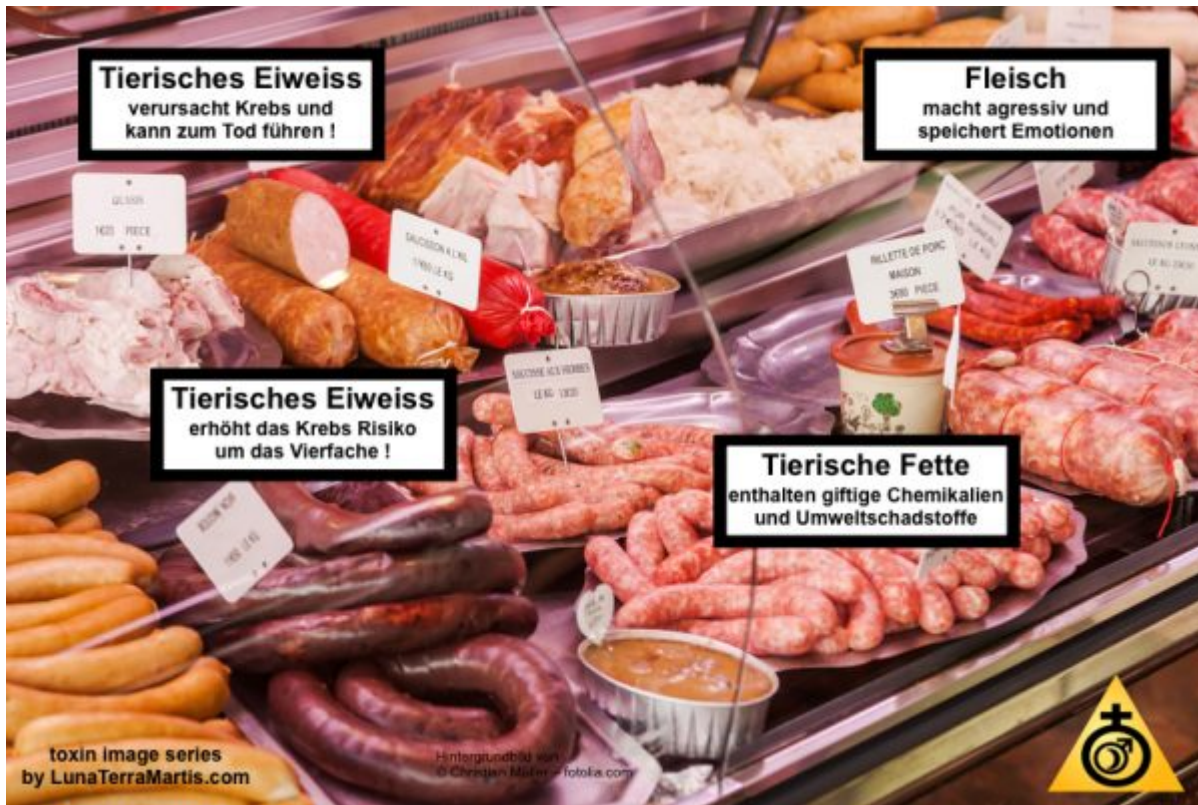
harmful radiation image series