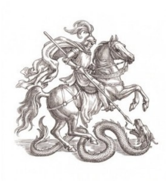
Ritter im Kampf gegen eine Schlange