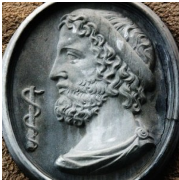
Griechenland, God Asclepius im Zusammenhang mit der Schlange