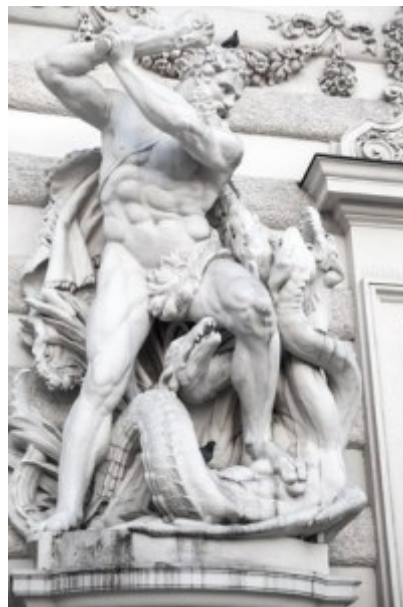
Hercules mit Hydra Schlange, Wien Österreich