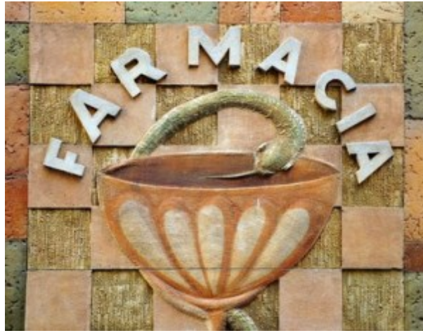
altes Symbol für eine Apotheke