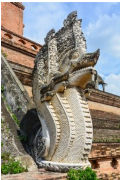
Thailand, Tempel mit Monsterschlange