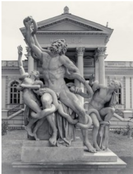
Laocoon Skulptur mit Schlange in Odessa, Ukraine