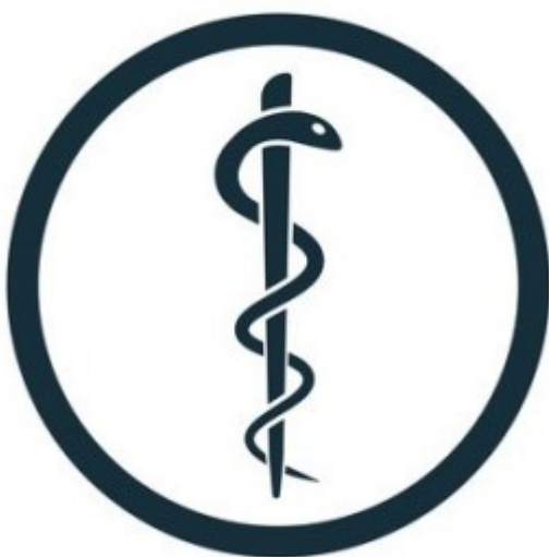
Medizin, Pharma, Macht Symbol mit Schlange