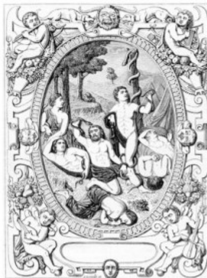
Die Israeliten vor der unverschämten Schlange