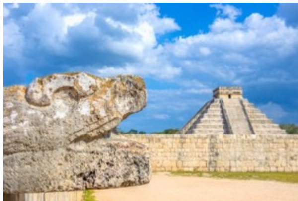
Mexiko, Pyramide mit Schlangenkopf