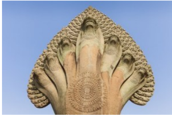
Schlangengott Asien, vor Tempel in Cambodia