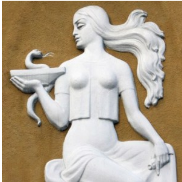
Griechenland, Göttin mit Schlange