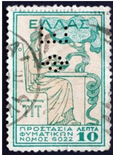
Griechenland, Briefmarke von 1934 mit Schlange