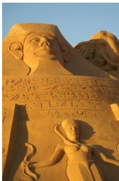
Ägypten, Pyramiden Skulptur mit Schlange in der Hand