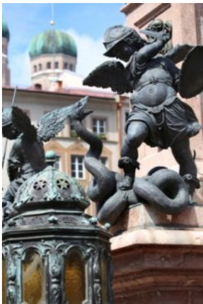
Deutschland, Engel im Kampf gegen die Schlange