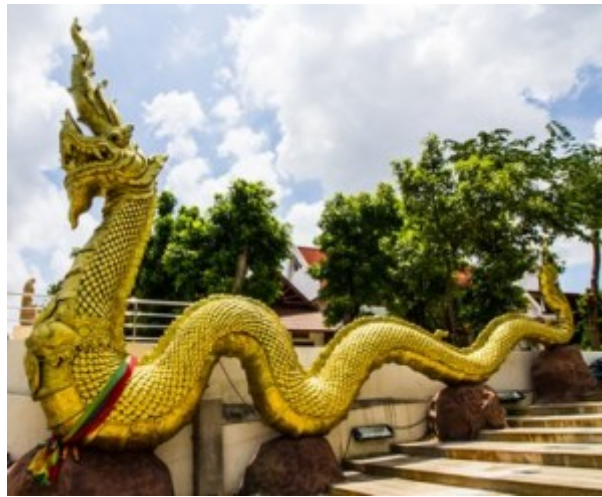
Thailand, Goldene Schlange