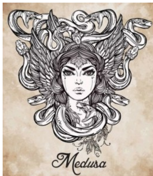
Griechenland, Gottes Tochter Medusa mit Schlangen