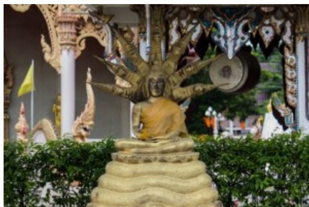
Thailand, Tempel mit Buddha auf Schlange sitzend