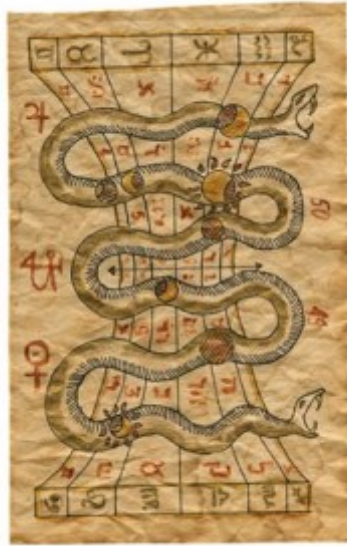
aus einem schwarzmagischen Buch