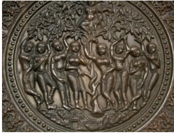
Carving wood, Baum mit Schlange ?